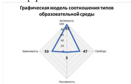
Рис.1. Модель текущего состояния среды организации

Таким образом, можно сделать вывод, что особенностью образовательной среды школы является выраженная «карьерная» среда. Важно обратить внимание на недостатки образовательной среды и создать условия, которые бы способствовали активности и свободе ребенка, то есть творческой атмосфере.