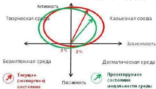
Рис.2. Модель проектируемого состояния среды организации

Можно сказать, что проектируемое состояние стремится к «творческой» среде, формирующей более свободного и активного ребенка. Важной задачей является изменение модальности в сторону творческой среды.