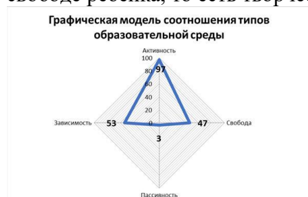
Рис.1. Модель текущего состояния среды организации

Таким образом, можно сделать вывод, что особенностью образовательной среды школы является выраженная «карьерная» среда. Важно обратить внимание на недостатки образовательной среды и создать условия, которые бы способствовали активности и свободе ребенка, то есть творческой атмосфере.