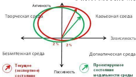
Рис. 2. Модель проектируемого состояния среды организации

Можно сказать, что проектируемое состояние стремится к «творческой» среде, формирующей более свободного и активного ребенка. Важной задачей является изменение модальности в сторону творческой среды.