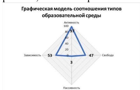
Рис. 1. Модель текущего состояния среды организации

Таким образом, можно сделать вывод, что особенностью образовательной среды школы является выраженная «карьерная» среда. Важно обратить внимание на недостатки образовательной среды и создать условия, которые бы способствовали активности и свободе ребенка, то есть творческой атмосфере.